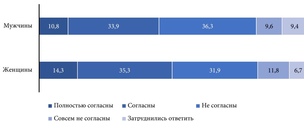
Рис. 2. Распределение ответов на вопрос «Согласны или не согласны Вы с тем, что если жена работает, то она пользуется в семье бóльшим уважением, чем если она просто домохозяйка?» в зависимости от пола респондентов, 2024 г., %

В связи с этим представляет интерес, что мнения респондентов по поводу влияния вовлеченности женщины в оплачиваемый труд на степень ее уважения в семье разделились практически поровну (рис. 2). Среди опрошенных 49,6% женщин и 44,7% мужчин согласились с тем, что если жена работает, то она пользуется в семье бóльшим уважением, чем если она просто является домохозяйкой, тогда как свое несогласие с таким суждением выразили 43,7% и 45,9% респондентов соответственно. Среди последних подавляющее большинство составляют сторонники такого семейного уклада, который строится на незыблемых основаниях взаимного уважения и взаимопомощи, равной ответственности перед семьей всех ее членов. Примечательно, что мнения по этому вопросу женщин, работающих и не работающих вне дома, состоящих в браке и не состоящих в браке, оказались практически идентичными.