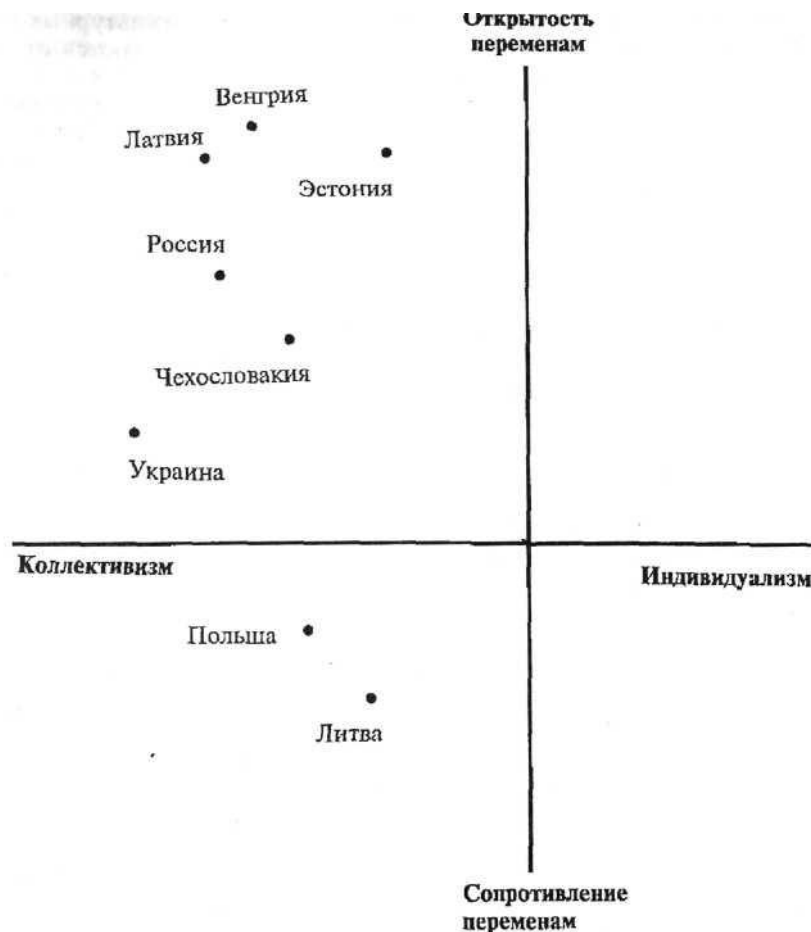
Рис. 3. Россия и страны Восточной и Центральной Европы на социокультурной карте

Попробуем теперь выделить социоисторические обстоятельства, которые объяснили бы достаточную компактность расположения России и трех других стран на социокультурной плоскости. Прежде всего «на поверхности» лежит тот очевидный факт, что и экономика, и культура, и идеология государств социалистического содружества создавались по единому сценарию и координировались из единого центра. Можно было бы попытаться объяснить геометрию точек (рис. 2) действием «славянского фактора», но многого на этом пути, думается, не достичь. Так, и неславянская Венгрия, и славянская Польша равноудалены на социокультурной карте от России. Далее. Чехи, словаки и поляки относятся к западной ветви славян, имеют близкие языки и множество сходных элементов в традиционной культуре, однако «социокультурное расстояние» между Россией и Чехословакией заметно меньше, чем между Россией и Польшей. С другой стороны, учитывая, что значительная часть Польши с конца XVIII века входила в состав Российской империи, естественно было бы допустить большую общность российской (русской) и польской ментальности.